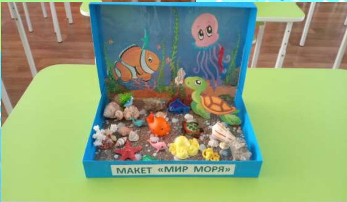
Макет «Мир моря»