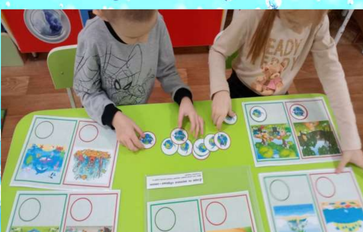
Дидактическая игра «Хорошо – плохо»