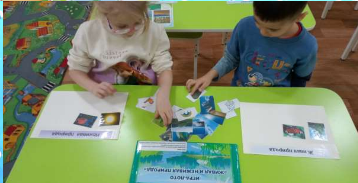
ИГРА-ПОТО «ЖИВАЯ И НЕЖИВАЯ ПРИРОДА»