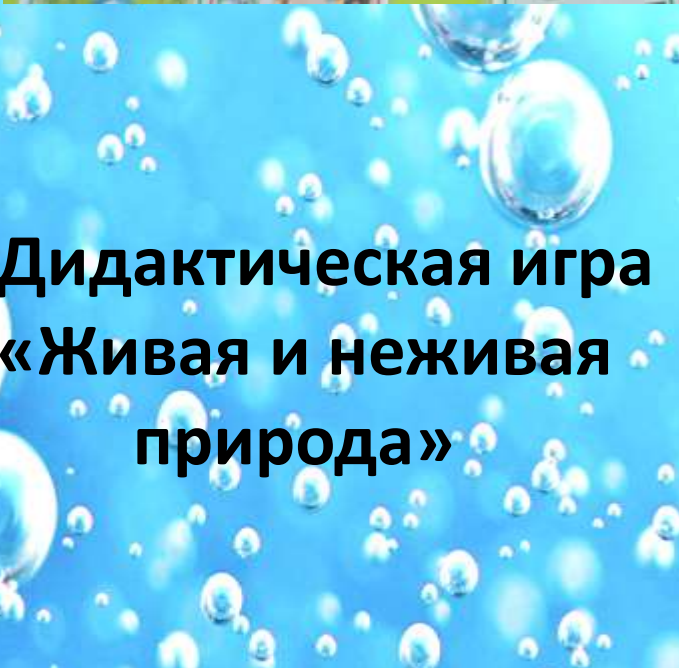
Дидактическая игра «Живая и неживая природа»